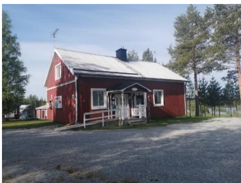
Bygdegården i Åträsk den gamla skolan.

Åträsk bygdeförening har anor sedan slutet av 1940-talet. 1947 och bildas ”Åträsk byggnadsförening”, den föreningen kallar man också i protokoll och kassaböcker ibland ”Åträsk ekonomiförening” och även ”Åträsk bygdeförening”. 1967 slutar alla protokoll från ”Åträsk Byggnadsförening”.