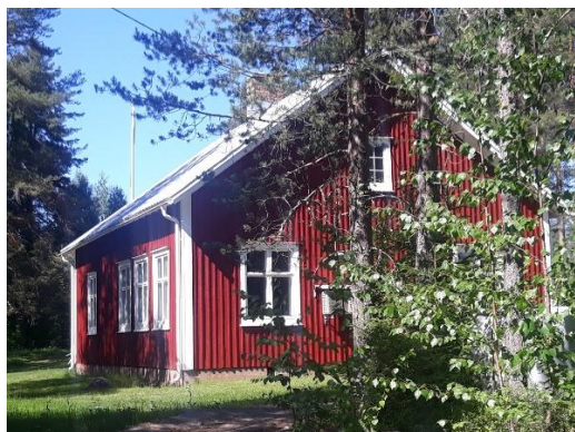
Yttersta hembydsgård i sommarprakt.

Ytterstfors byamän beslutade den 11 februari 1952 att bilda en hembygdsförening vilket också var skolstyrelsens krav för att man skulle få överta det trettio år gamla skolhuset som byns samlingslokal. Protokollet från detta möte finns inramat och hänger på väggen i hembydsgården. Detta är starten för Yttersta hembygdsförening och hembydsgården invigdes den 28 augusti 1955.