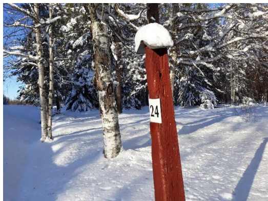
Kilometerstolpe av trä i Yttersta, 24 km till sockenkyrkan i Öjebyn.

Se även: https://www.facebook.com/yttersta/