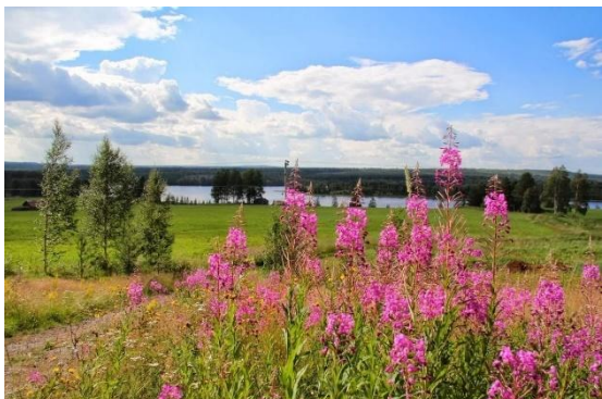
Utsikt från byagården ut över sjön.